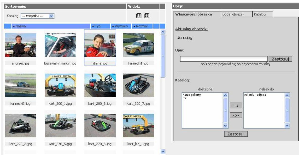
Rysunek 4. Zarządzanie obrazkami na przykładzie panelu dla carint.pl

Pliki graficzne dołączane do biblioteki obrazków automatycznie tworzą swoje miniaturki zdjęć oraz dostosowują rozdzielczość tak, by serwis ładował się szybko.